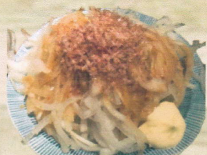
オニオンスライス