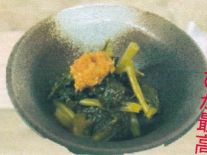
葉わさび醤油漬け