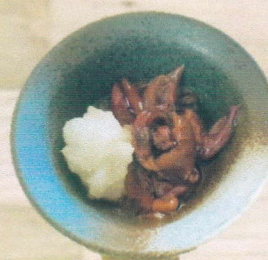
ホタルイカの沖漬け