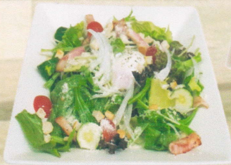
ベーコンと温泉卵の