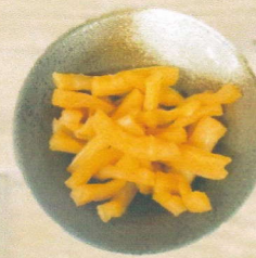
こりこり大根醤油漬け